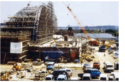
夢の島熱帯植物館 建設中