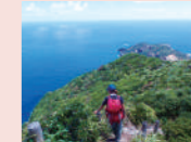
母島乳房山馬の背

場所▶映像ホール 座席数▶50名 対象▶ファミリー向け 参加費▶無料(入館料別途) 講師▶東京都レンジャー 協力▶東京都小笠原支庁 申込▶オンライン受付 2/2 21:00~