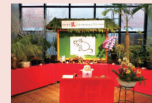
過去の植物展のようす

2023年の干支「卯」にちなんだ植物をご紹介します。ふわふわの耳や足跡に似た葉など、うさぎを思わせるユニークな植物が大集合!