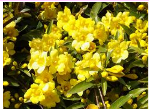
▲カロライナジャスミン

また特筆すべき点は、茎・根・葉・花などすべての部分が有毒であることです。そのため以前アメリカでは、鎮痛剤などの医薬品として用いられていました。