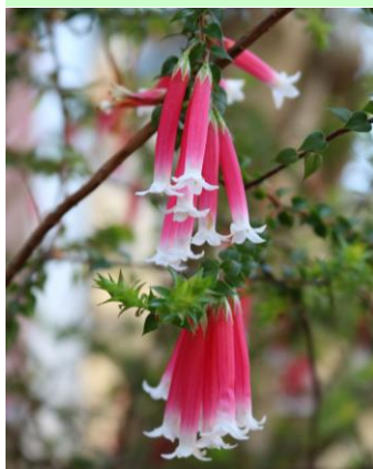
▲エパクリス・ロンギフロラ